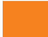
2 - naranja II