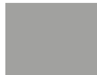
14 - negro PR-PO