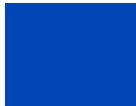
10 - azul 2R